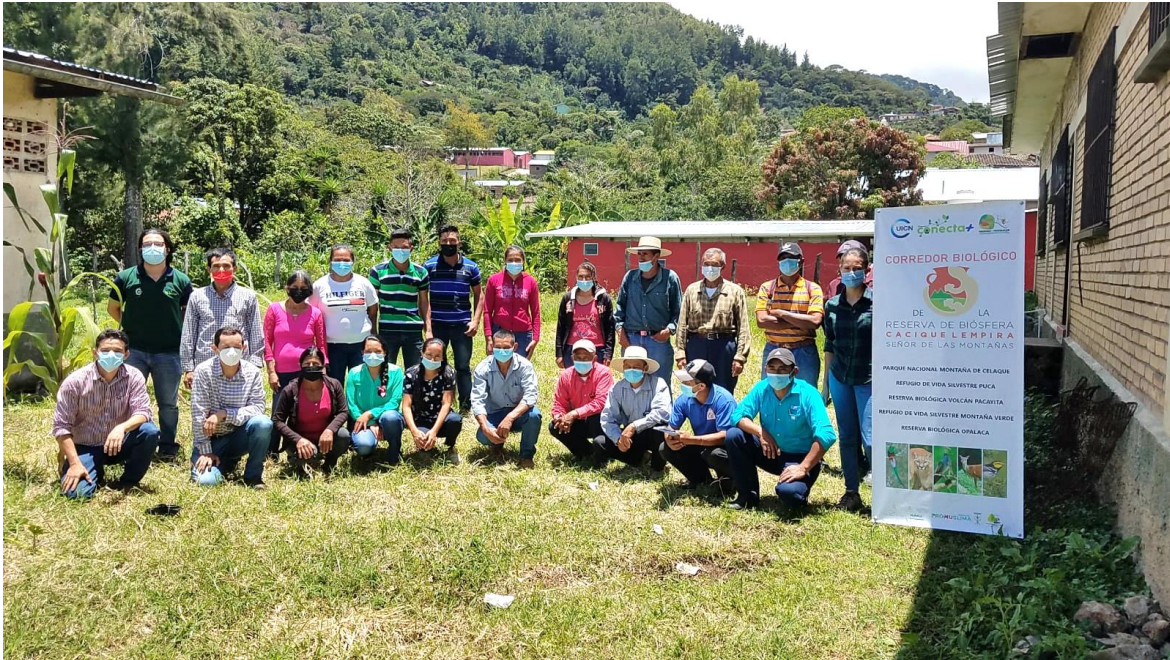
CLPI en Belén Gualcho Ocoatepeque.