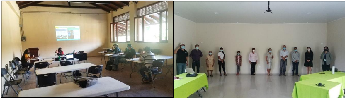
Reuniones del CLPI en Municipio de Gracias L