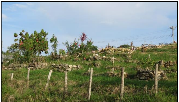
Cementerio de Piedras