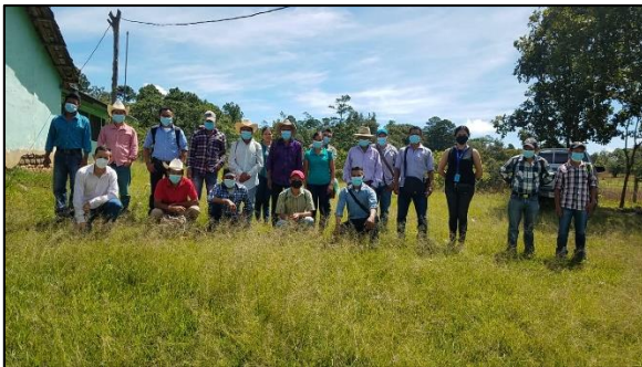
CLPI San Marcos de Caiquín