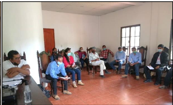
CLPI La Campa