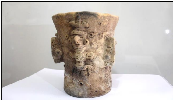
Vasija Lenca de aprox 900 DC