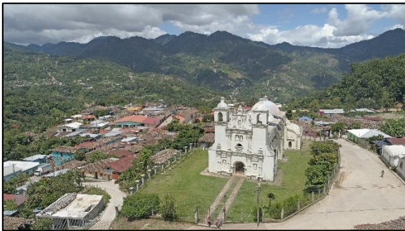
Iglesia de Santa María de Gualcho