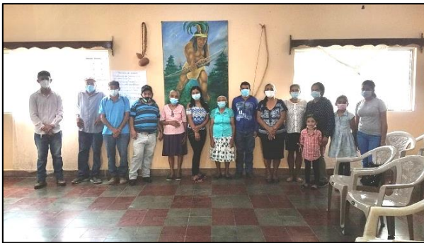
CLPI Gracias Lempira