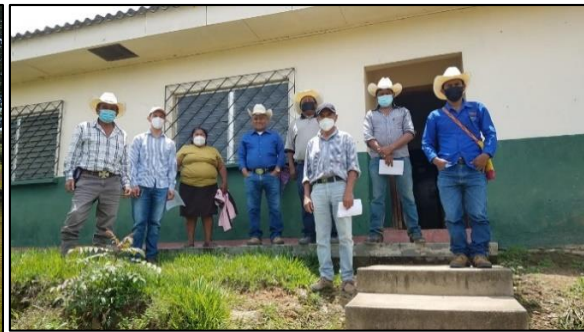
CLPI San Manuel de Colohete