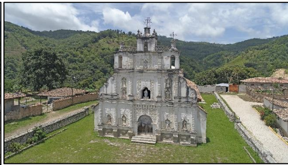
Iglesia Inmaculada Concepción